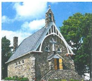
Sanctuaire du Sacré-Cœur de Beauvoir 675, côte de Beauvoir Sherbrooke (Qc) J1C 0B8 819-569-2535

Procession aux flambeaux après la messe de 19 h 00 (28 juin)